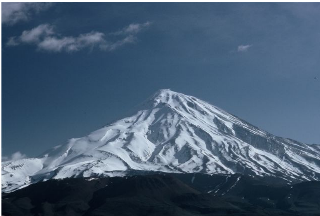
Demawend von Süden

Der Demawend, auch Sitz der Geister genannt, ist der höchste Berg des Iran, unweit der Hauptstadt Teheran. Die Anforderungen zur Besteigung des erloschenen Vulkans sind ähnlich einer Elbrus Besteigung. Zu Beginn der Reise akklimatisieren wir uns am „Plateau der Viertausender“.